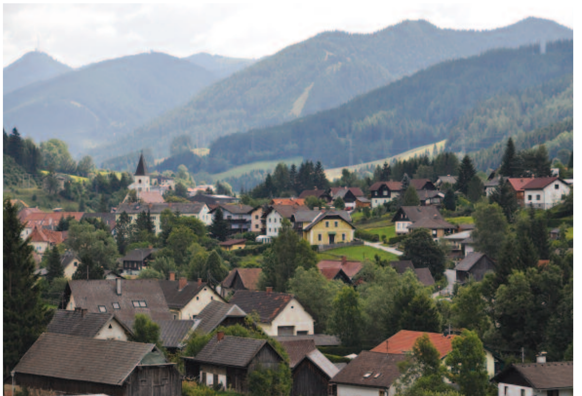
Osztrák alpesi táj

Bécsújhelyt elhagyva, a szerelvény délnek irányul. Nemsokára az erdélyihez hasonló lesz a táj, majd a távolban feltűnnek a hegyek. Többször megállapítjuk, a zöldellő völgyek szépsége olyasfajta, csak egy kicsit rendezettebb a környezet és a települések. Mi több, a fafeldolgozó egységek udvarán már-már zavaró a rend. Élesen felfelé tartunk, egy-egy kimagasló hegycsúcson középkori várak, templomok, kolostorok őrzik a mély völgyeket. S mire elmerülünk a táj csodálatában, megszámlálhatatlanul sok alagút következik, ahova pillanatok alatt el-, majd kibújik a szerelvény. A Semmering-hágón járunk. Igazi műszaki bravúrral épült meg ezen a