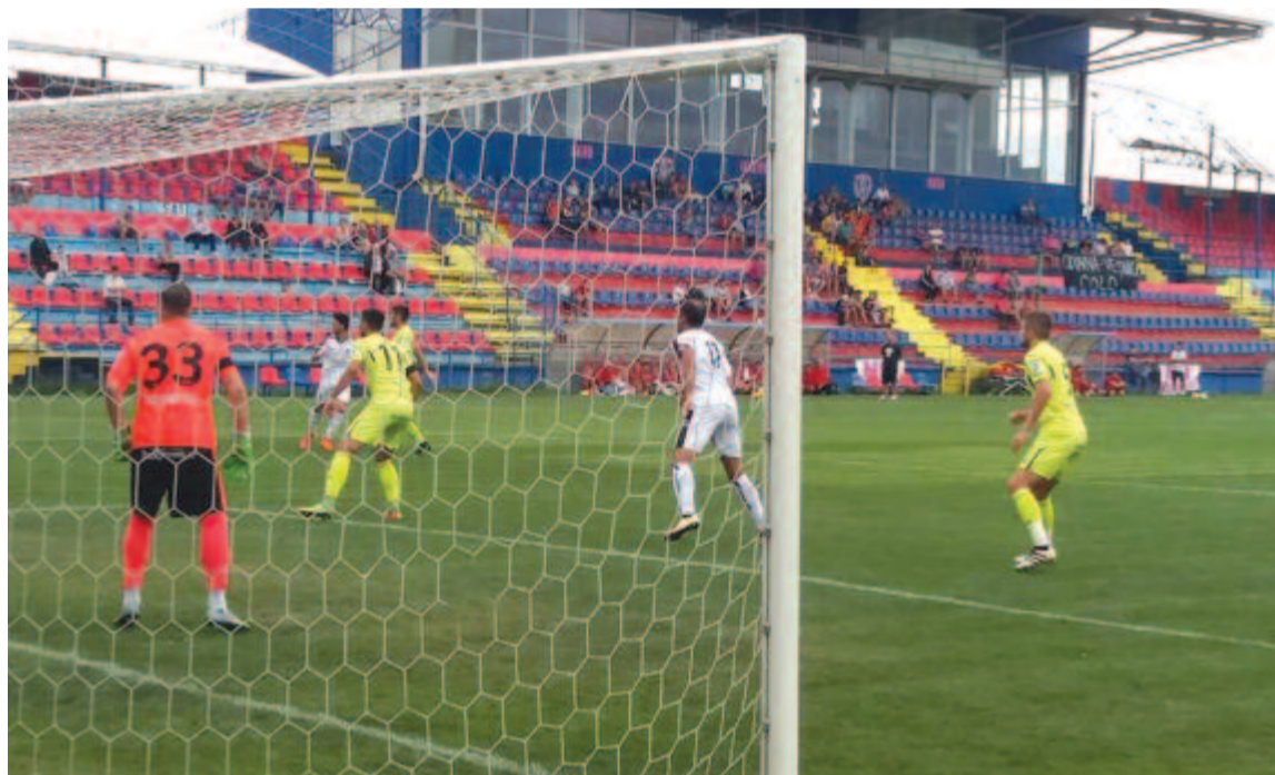
Mindössze egy góllal tudta felülmúlni az ASA az egy osztállyal lennebb szereplő FK Csíkszeredát.

Csíkszeredai FK: Nagy – Csiszér, Benkő, Lőrincz, Lakatos, Tamás, Csűrös, Jebari, Eder, Hodgyai, Bajkó. Második félidő: Horváth – Majzik, Savin, Székely, Vizi, Bartók, Jakab, Bálint, Györgyi, Bagoly, Kénesi.