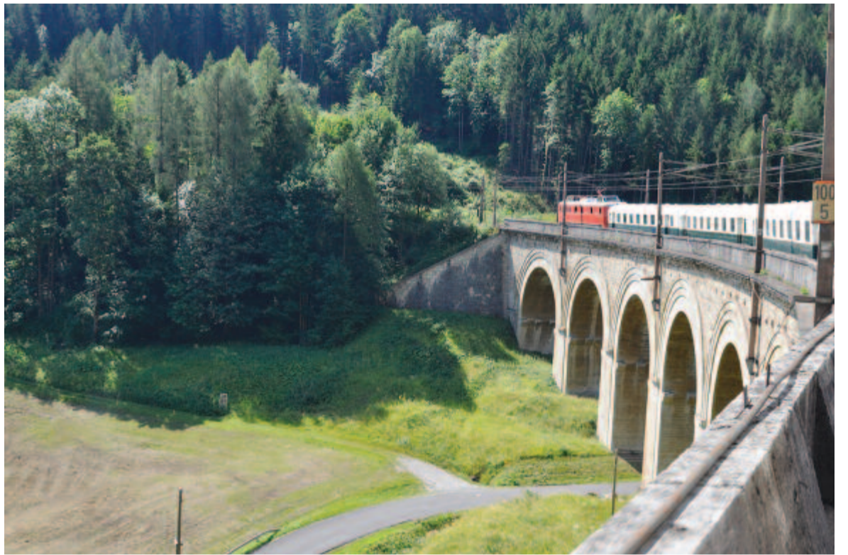
A semmeringi vasúton

„Az első világháború kitörésekor Olaszország semleges maradt, mivel az 1882-ben megkötött hármas szövetség (Németország, Olaszország és az Osztrák-Magyar Monarchia) tagja volt. Mivel területi igényeket fogalmazott meg Dél-Tirol, Dalmácia és Albánia irányába, titkos tárgyalásokba kezdtek a két szövetséges oldallal (Anglia és Franciaország). 1915. április 26-án Londonban megszületik az egyezmény, amelynek alapján területet ígérnek Olaszországnak az Antant hatalmak, így 1915 júniusában négy olasz hadsereg sorakozott fel a Osztrák-Magyar Monarchia határán. Céljuk az