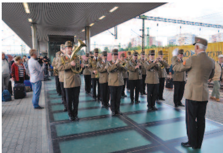
Az MH vitéz Szurmay Sándor Budapest Helyőrség Dandár Központi Zenekara