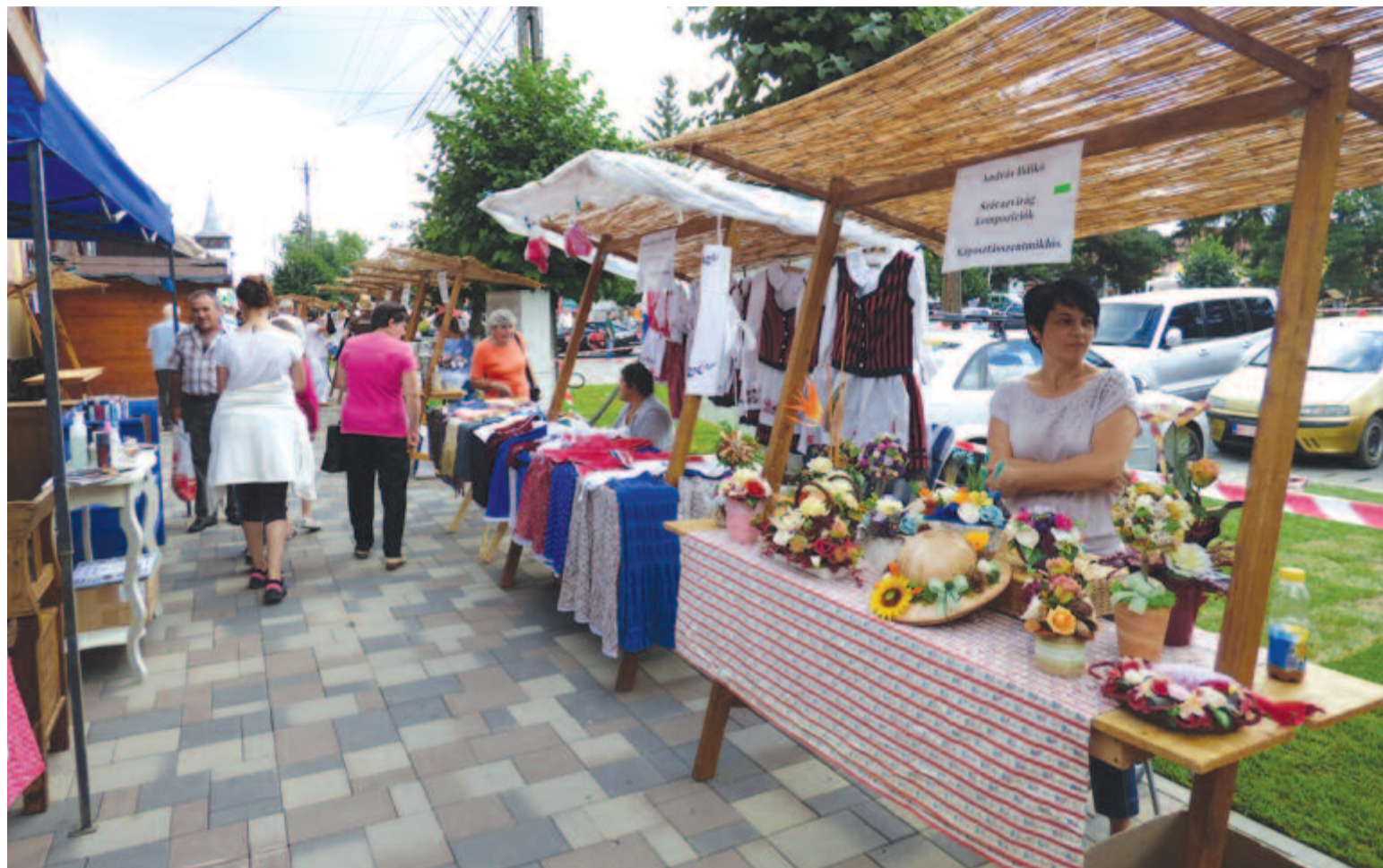
Harcinc termelő kínálta portékáit a vásárrban