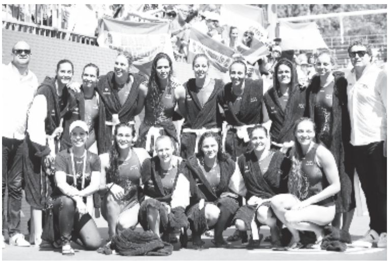
A magyar csapat a női vízilabdatornán az 5. helyért játszott Olaszország – Magyarország (8-10) mérkőzés után a 17. vizes világbajnokságon a Hajós Alfréd Nemzeti Sportuszodában 2017. július 28-án.

A magyar női vízilabda-válogatott az ötödik helyen végzett a budapesti vizes világbajnokságon, miután a pénteki helyosztón 10-8-ra legyőzte az olasz együttest.