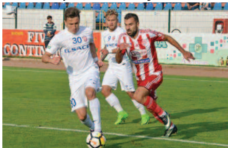
A házigazdák már az első percben (egészen pontosan az 50. másodpercben) megszerezték a vezetést

Nagyon kikaptak a háromszékiek a labdarúgó 1. liga 3. fordulójában: a Botoșani FC négygólos vereséget mért az újonc Sepsí OSK-ra.