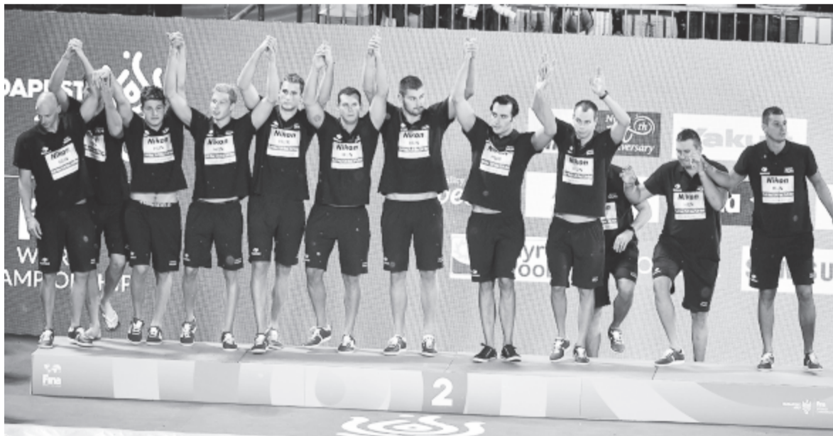
A második helyezett magyar csapat a 17. vizes világbajnokság férfívízilabda-tornájának eredményhirdetésén a Hajós Alfréd Nemzeti Sportuszodában 2017. július 29-én.

A Hajós uszodában zsúfolt nézőtér, vagy nyolcezer lelkes szurkoló előtt kezdődött a döntő, horvát akciógóllal. A rivális egyik legjobbjá,